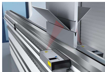
※1 非接触式角度測定ACBレーザー

操作性を重視した作業者の負荷を軽減する先進的なマンマシンインターフェース モバイルコントローラーにより作業者の無駄な移動を削減し、高効率作業を実現